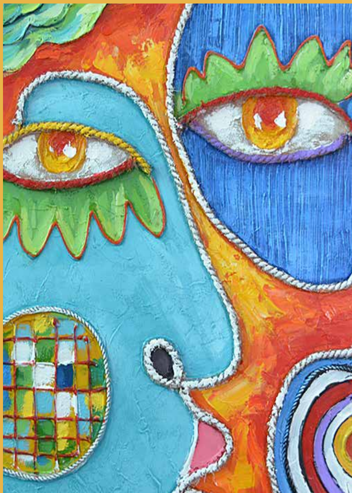
Photos Régis Nardoux - Imprimerie DECOMBAT - Ne pas jeter sur la voie public.